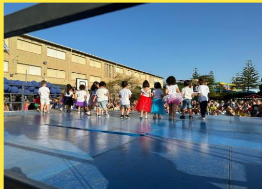
FIESTA FIN DE CURSO