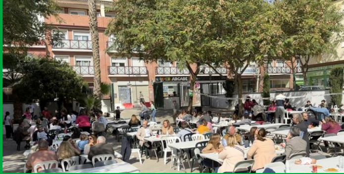
COMIDA DE CONVIVENCIA – DÍA DE ANDALUCÍA