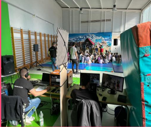
GRABACIÓN DE PROGRAMAS DE LA TELEVISIÓN LOCAL