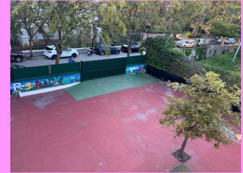
ENTRADA INFANTIL 4-5 AÑOS Y 1º, 2º Y 3º E.P.