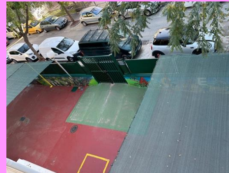
ENTRADA INFANTIL 3 AÑOS