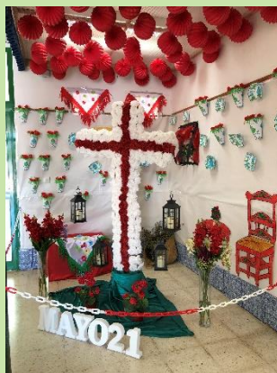
CRUZ DE MAYO